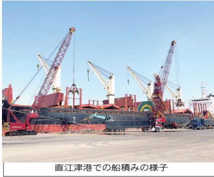
直江津港での船積みの様子

日本国内とアジアを 結ぶ日本海側の物流拠 点として2010年に1ト ン当たり1万6000 開設した直江津港。0 ト、シュレッダーを